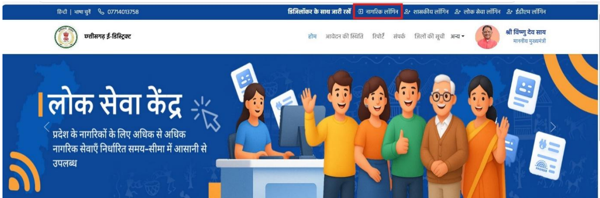
चित्र क्रमांक 2: नागरिक लॉगिन बटन

लॉगिन करने के लिए होम पेज पर नागरिक लॉगिन बटन पर क्लिक करें।