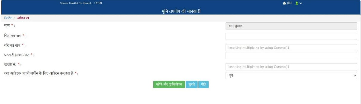
चित्र क्रमांक 11: भूमि उपयोग की जानकारी हेतु आवेदन फॉर्म

चरण 5.1: आवेदन फॉर्म में ज़रूरी जानकारियाँ दर्ज करें।